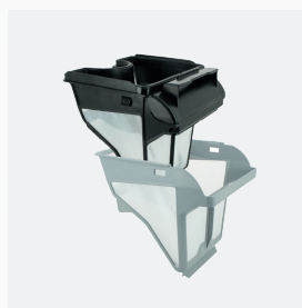
Bac filtrant Filtre double niveau : 150/60 µ