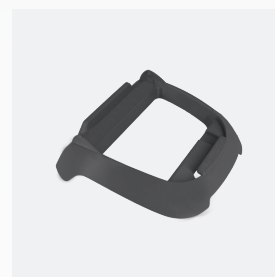
SoCLE pour boîtier de commande